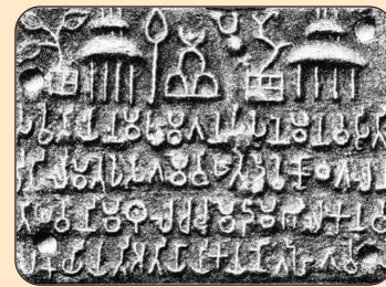
સોહગૌરા તામ્રપત્ર, ઉત્તરપ્રદેશ

કાલાંતરે સંસ્કૃત લેખનની શરૂઆત કુશાણ કાળમાં થઈ. તે પૂર્વે સંસ્કૃત ભાષા શ્રુત-શ્રવણ સ્વરૂપમાં દૃઢ હતી. અશોકના સમયમાં સંસ્કૃત શિલાલેખોમાં અવતરિત ન હતી થઈ શકી. આ સમયમાં બ્રાહ્મીએ પોતાના સ્વરૂપમાં સહજ પરિવર્તન (મોડિફિકેશન) સ્વીકારી લીધું. તે સમયના વિદ્વાનો, સંશોધકો અને અભ્યાસકો બ્રાહ્મી લિપિને જ પરિષ્કૃત કરીને પરિવર્તિત કરતા રહ્યા.