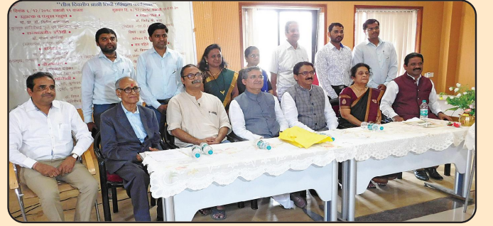
બ્રાહ્મી લિપિ પ્રશિક્ષણ કાર્યશાળા અતિથિ

આ કાર્યશાળામાં ડોક્ટર, ઇજીનિઅર, પુરાતત્ત્વ વિભાગ, ઇતિહાસ વિગેરે અલગ અલગ ક્ષેત્રોના સહયોગી ઉપસ્થિત રહ્યા હતા. ત્રણ દિવસની