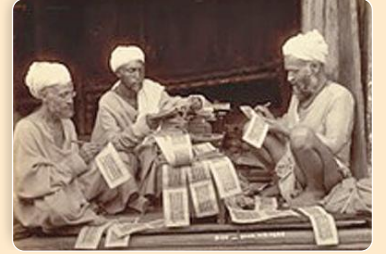
પ્રાચીન લેખન પદ્ધતિ

મંદિર છો મુક્તિતણી માંગલ્યકીડાના પ્રભુ. પરંતુ બધા શું બોલે છે? બધા મુક્તિતણા એમ બોલે છે. મુક્તિતણી માંગલ્યકીડા આ વ્યાકરણ