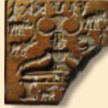
સિંધુ ઘાટી સભ્યતામાં પશુપતિ

૨. ભાવલિપિ - ભાવલિપિ ચિત્રલિપિનું વિકસિત સ્વરૂપ છે. જેમ કે ગોળ આકૃતિનો અર્થ સૂર્ય, તાપ, પ્રકાશ, તારા એવો થાય. દુઃખના સમયને દર્શાવવા આંખમાંથી પડતાં આંસુના ટીપાંનો પ્રયોગ થાય છે. ભાવલિપિનાં ઉદાહરણ ચીન, ઉત્તરી અમેરિકા, પશ્ચિમ આફ્રિકા વગેરે દેશોમાં જોવા મળે છે.