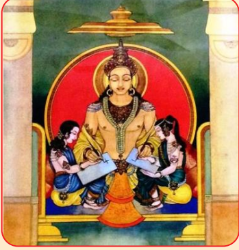
બ્રાહ્મી-સુંદરીને લિપિ અને અંકગણિત શીખવતા ભ. ઋષભદેવ

પ્રાચીન ભારતીય સંસ્કૃતિ અને ઇતિહાસનો અભ્યાસ લિપિ અને ભાષાના જ્ઞાનથી થાય છે. આપણી પ્રાચીન પરંપરા સાંભળીને યાદ રાખવાની