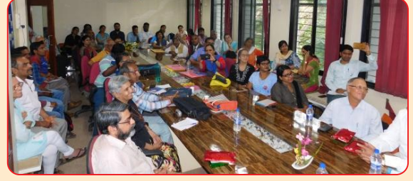
બ્રાહ્મી લિપિ પ્રશિક્ષણ કાર્યશાળા

આખા વિશ્વમાં આપણી સંસ્કૃતિના વૈભવના કારણે ભારતનું સ્થાન હંમેશા ઉંચું રહ્યું છે. આ સાંસ્કૃતિક વૈભવને આગામી પેઢી સુધી સક્ષમતાથી અને સતીકતાથી પહોંચડવાનું ભગીરથ કાર્ય જૈન અધ્યાસન અને શ્રુતભવન વગેરે સંસ્થાઓ કરી રહી છે. તે ખરેખર પ્રશંસાને પાત્ર છે. આ કાર્યશાળા સાંસ્કૃતિક વારસાને સમૃદ્ધ કરવાવાળી છે. - ડૉ. એન. એસ. ઉમરાણી (પ્ર-કુલગુરુ, પુણે વિદ્યાપીઠ)