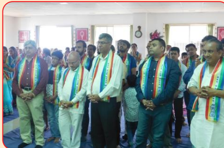
દિ. ૧૬-૦૮-૨૦૧૮ શ્રી અંકલેશ્વર ચેતાંબર મૂર્તિપૂજક જૈન સંઘ, અંકલેશ્વર