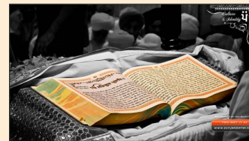
ગુરુ ગ્રંથ સાહિબ

પંજાબમાં સમર્પિત શીખ પરિવારના ઘરના ખૂણામાં નાનકડું મંદિર હોય છે જેને તેઓ ગુરુદ્વાર કહે છે. તેમાં ગુરુ ગ્રંથ સાહિબ વિરાજિત કરવામાં આવે છે. પરિવારના દિવસની શરુઆત ગુરુ ગ્રંથ સાહિબના પૂજનથી થાય છે.